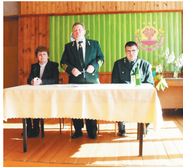
◆ Темой совещания, прошедшего 5 марта, стали вопросы соблюдения требований лесного законодательства при использовании лесов арендаторами, предоставления лесных деклараций и подготовки к пожароопасному сезону 2013 года.

Кроме арендаторов в работе совещания приняли участие представители самого лесничества, Минприроды Чувашии, Заволжского территориального управления Чебоксар.