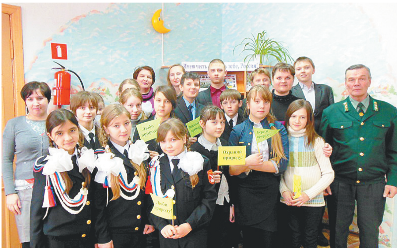
◆ Представители КУ "Шумерлинское лесничество" Минприроды Чувашии провели для учащихся 3-7 классов средних общеобразовательных школ Шумерли лекцию на тему защиты природы и охраны окружающей среды.

Подобная встреча с молодежью была организована в рамках Года охраны окружающей среды и Международного дня леса.